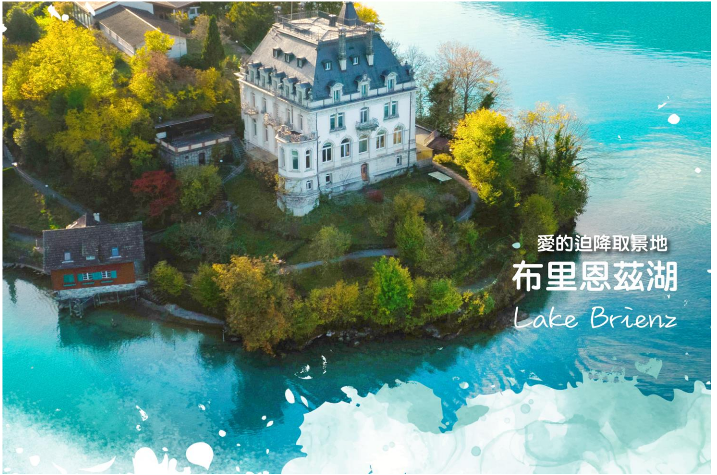
• 愛的迫降取景地 布里恩茲湖 Lake Brienz